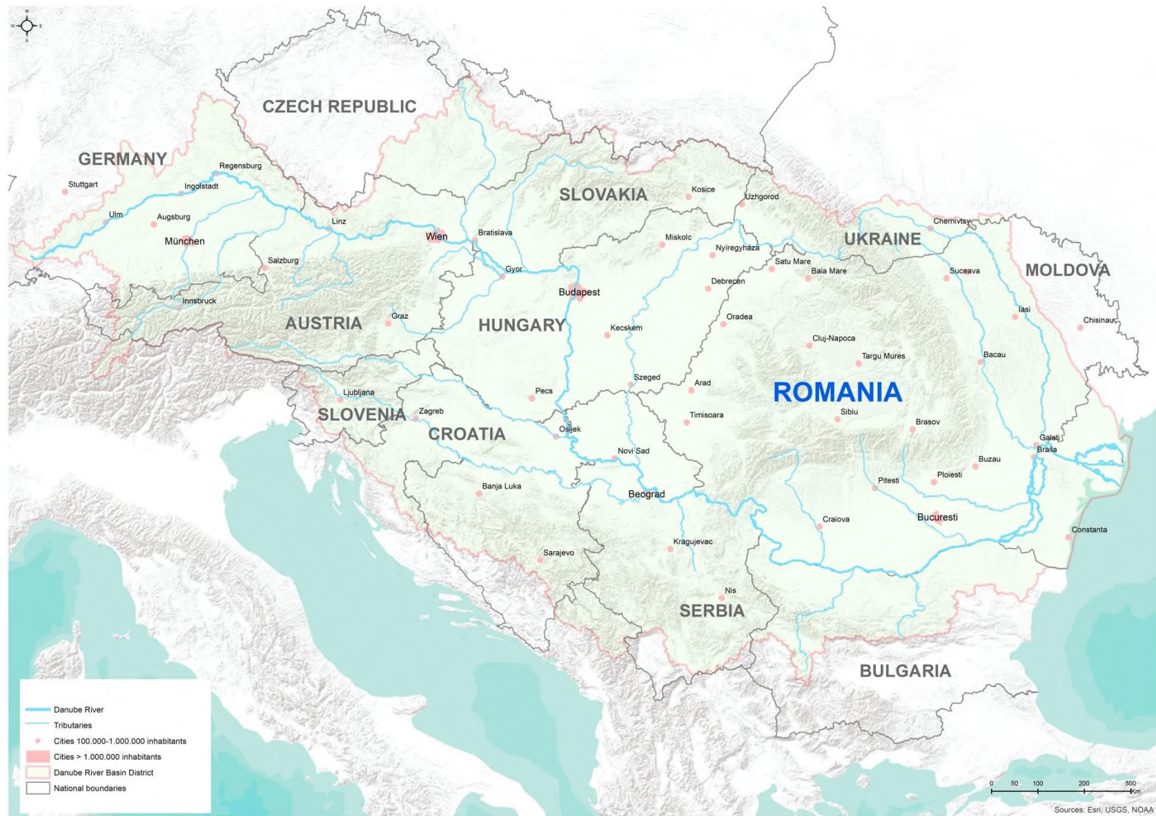
Figura 1.2. Districtul Hidrografic al Fluviului Dunărea